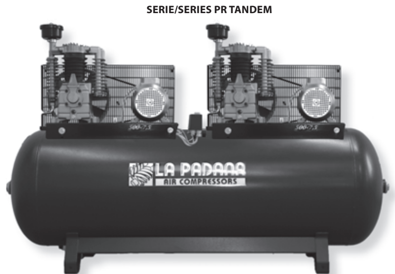
SERIE/SERIES PR TANDEM